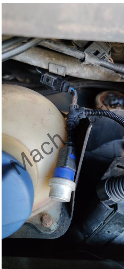
4. Místo pro průchod kabeláže do interiéru